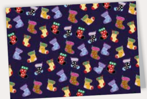
Ein schöner Brauch Best. Nr. 0615