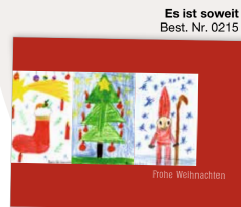
Es ist soweit Best. Nr. 0215