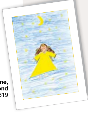
Engel, Sterne, Mond Best. Nr. 0319