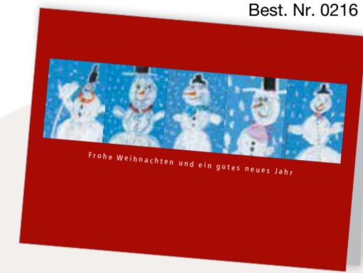
Fröhlicher Winter Best. Nr. 0216