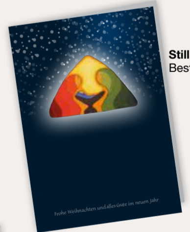
Still, still Best. Nr. 0413