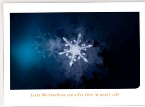
Stilles Leuchten Best. Nr. 0214