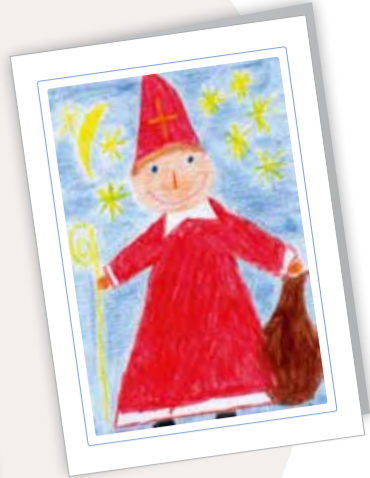
Lieber Weihnachtsmann Best. Nr. 1019