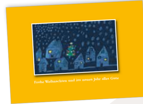
Schneestille Best. Nr. 0616