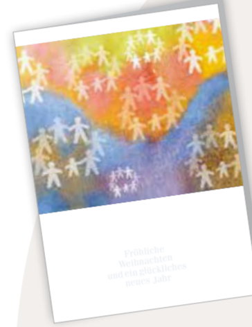
Wir stehen zusammen Best. Nr. 0115