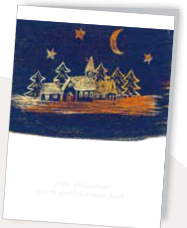
Stille Nacht Best. Nr. 0515