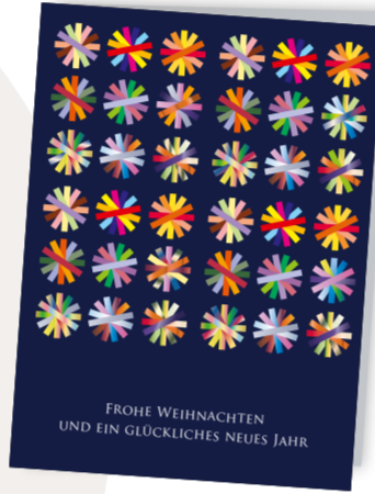
Leuchtende Sterne Best. Nr. 0316