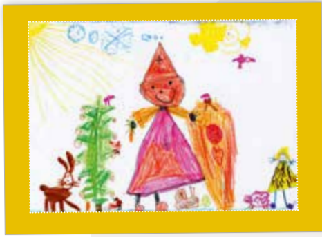
Waldweihnacht Best. Nr. 0119