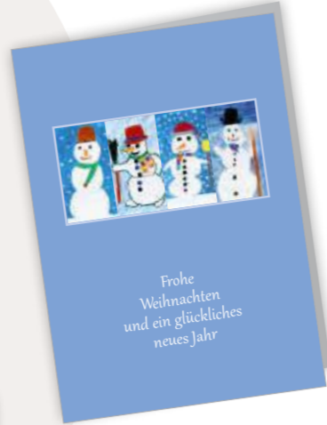
Fröhliche Schneemänner Best. Nr. 0519