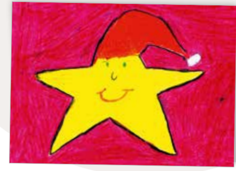
Weihnachtsstern Best. Nr. 0919