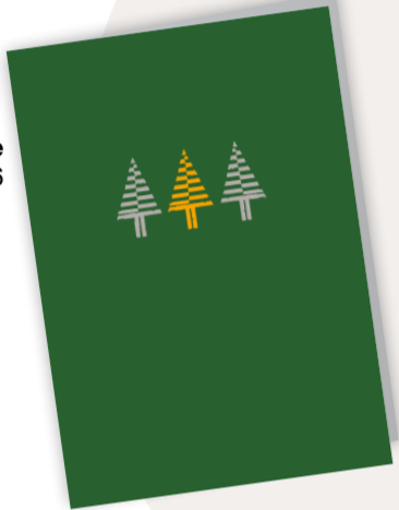
Drei Bäume Best. Nr. 0416