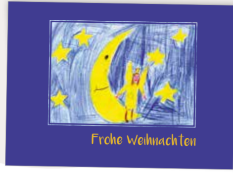
Endlich Weihnachten Best. Nr. 0419