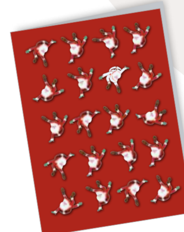
Weihnachtsfreude Best. Nr. 0715