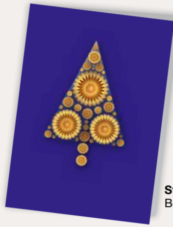
Sternbaum Best. Nr. 0913