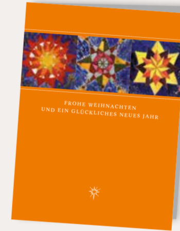
Kristallsterne Best. Nr. 0916