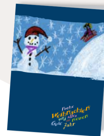
Schneetreiben Best. Nr. 0914