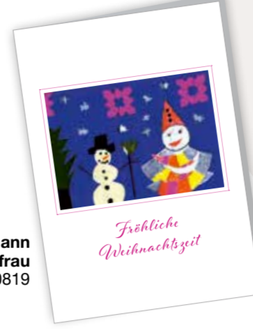
Schneemann und Schneefrau Best. Nr. 0819