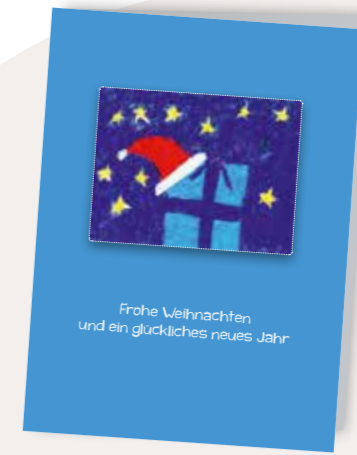
Ein schönes Geschenk Best. Nr. 0719