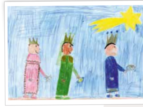
Die glücklichen Drei Könige Best. Nr. 0619