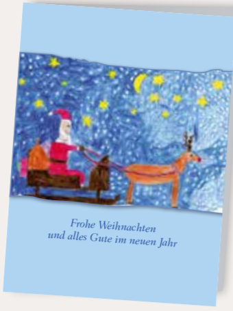
So viele Geschenke Best. Nr. 0219